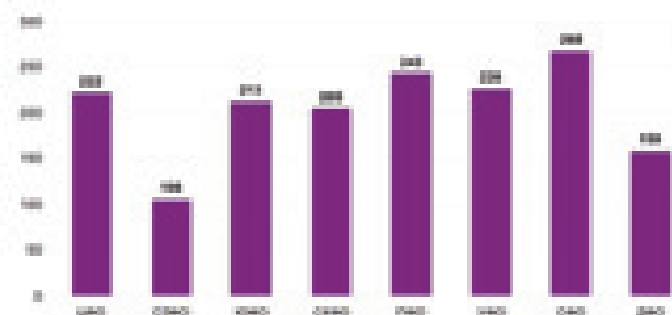
Динамика российского рынка с/х тракторов в натуральном выражении в 2005-2009 гг., тыс. шт. (источник: оценка Research.Techart)