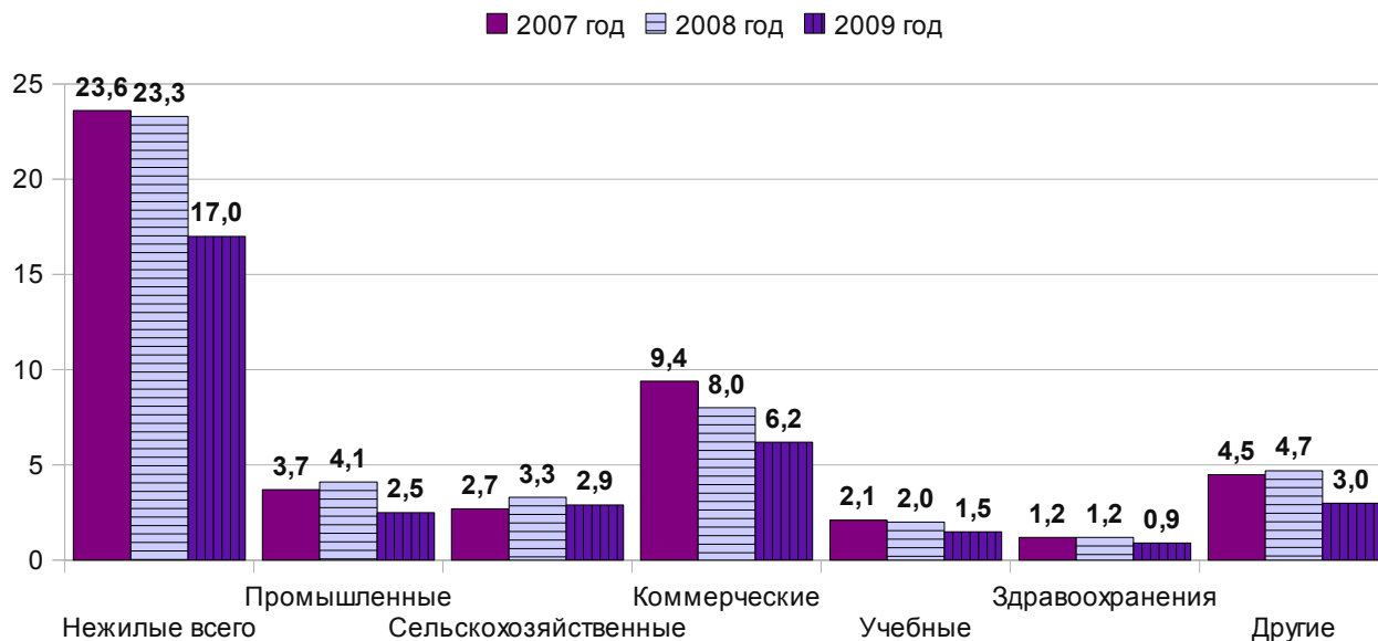
Рисунок 3. Ввод в эксплуатацию нежилых зданий в I-III кварталах 2007-2009 гг., млн. кв. м (источник: Росстат)

Влияние кризиса на нежилое строительство является более очевидным на сформировавшемся рынке недвижимости Москвы и Санкт-Петербурга. В регионах в связи с многократным превосходством спроса над предложением ожидается, что большая часть заявленных проектов строительства будет завершена. Тем не менее новые объекты для реализации являются единичными и их число сократилось по сравнению с обычным уровнем.