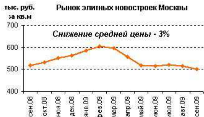
Диаграмма. Динамика средней цены предложения 1 кв. м на первичном рынке