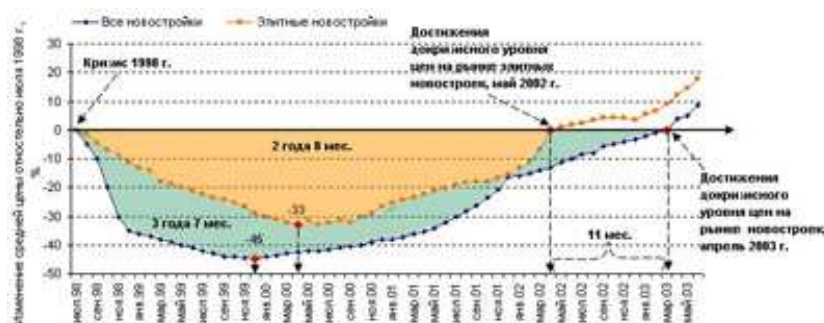
График. Сравнительная динамика восстановления цен на рынке новостроек после кризиса 1998 г.

Однако, несмотря на это, напомним, что уже к началу 2000 года первичный рынок начал восстанавливаться. Его восстановление длилось почти на год дольше, чем в сегменте элитного жилья. Недвижимость, приобретенную в период кризиса, спустя год можно было продать на 14-15% дороже. Таким образом, возвращение к докризисным показателям на первичном рынке произошло через 3 года и 7 месяцев после начала кризиса, а в элитном сегменте 2 года и 8 месяцев.